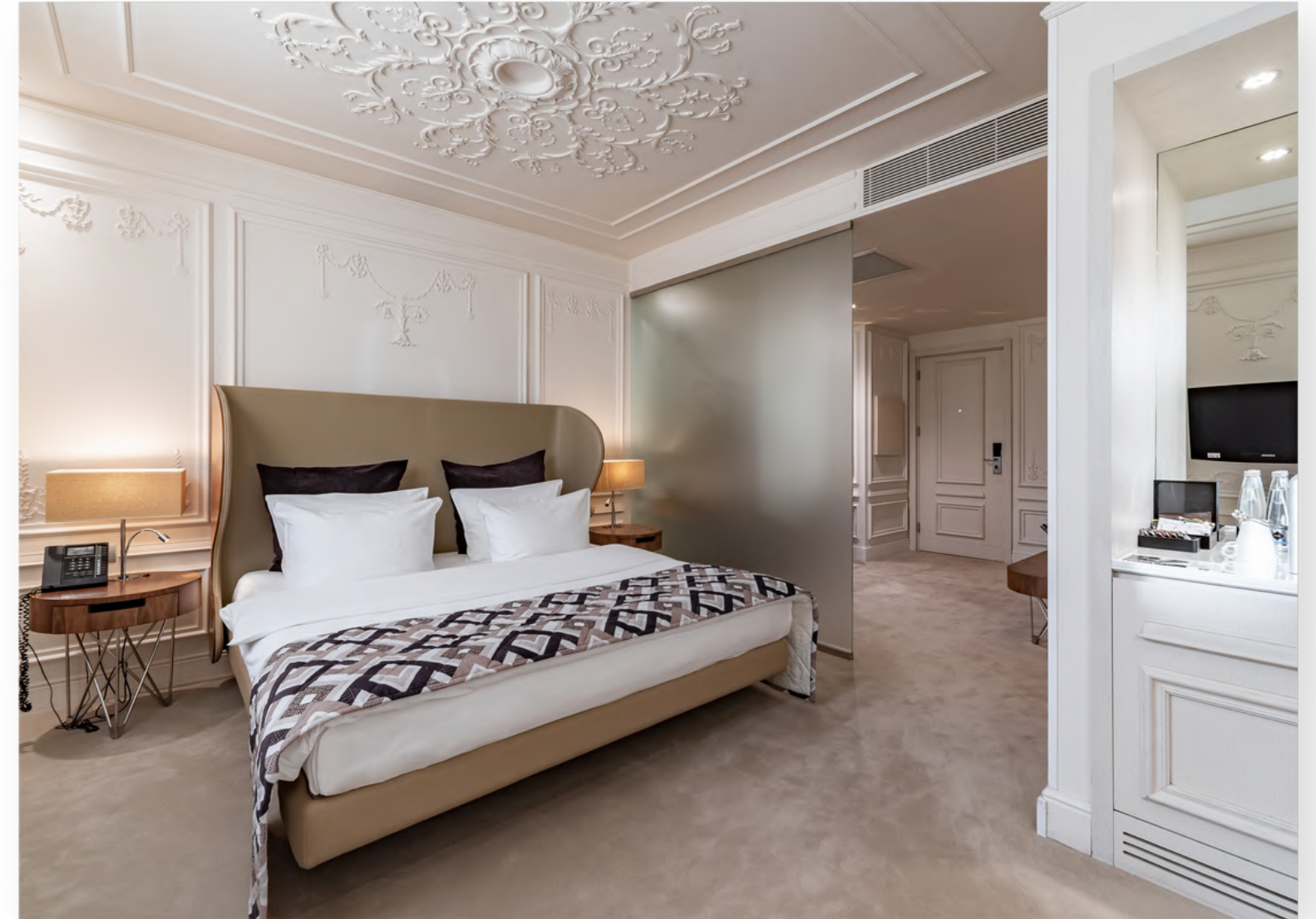
На фото: Люкс