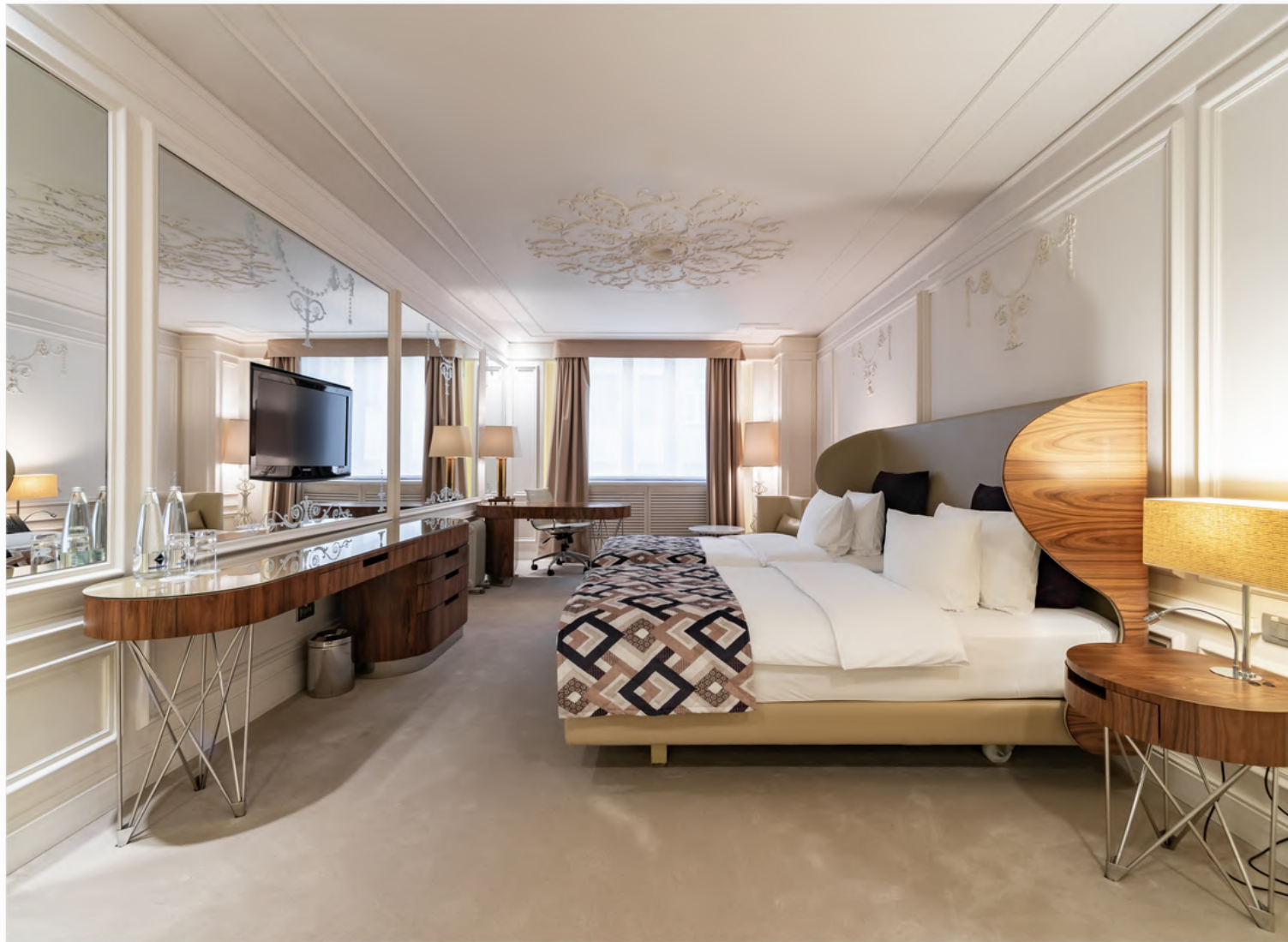
На фото: Премиум