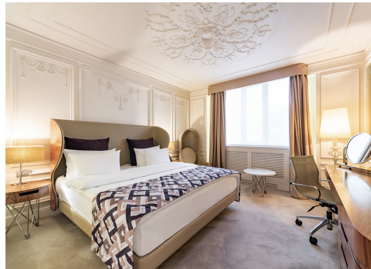
На фото: Делюкс