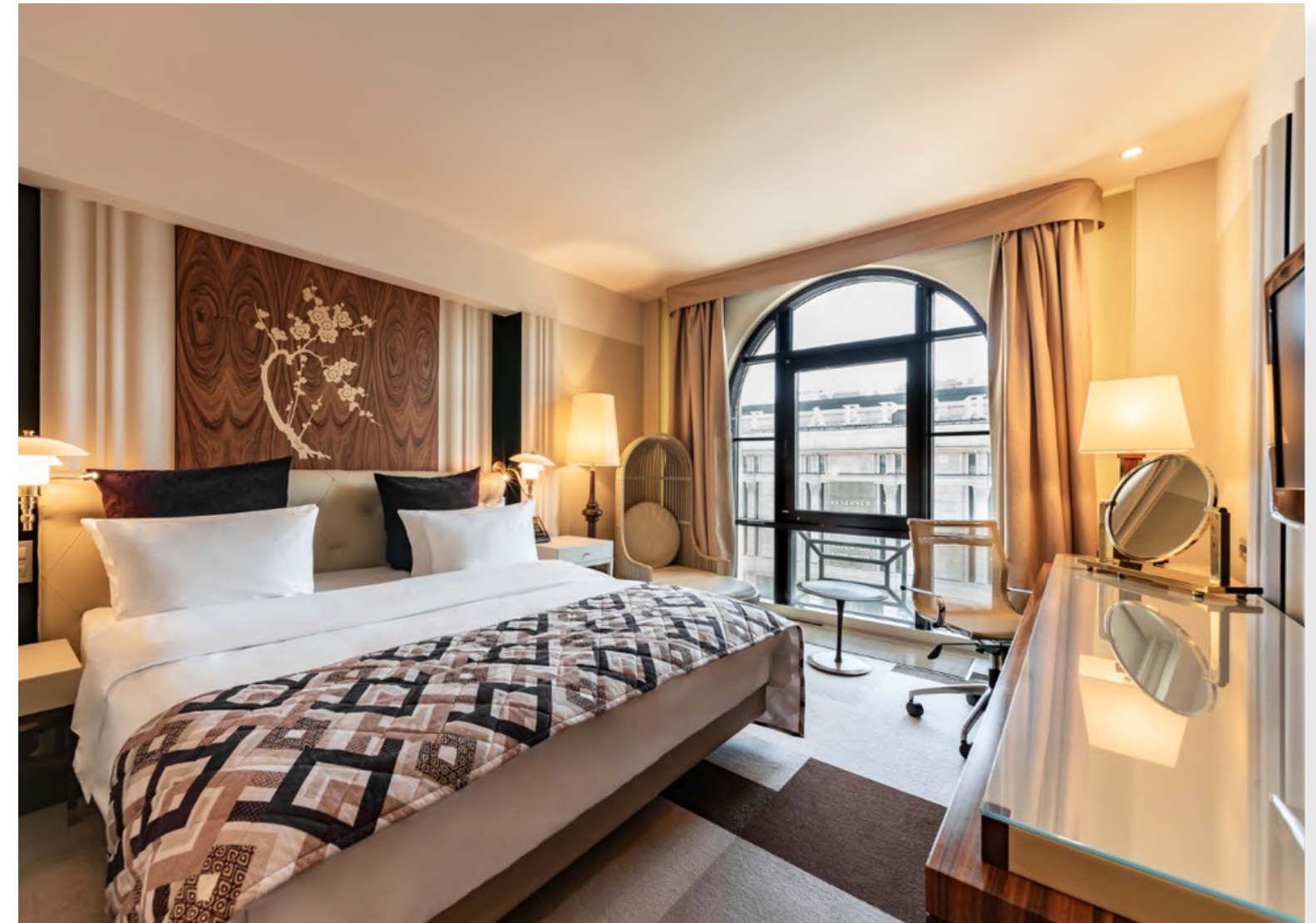
На фото: Улучшенный номер с Французским окном