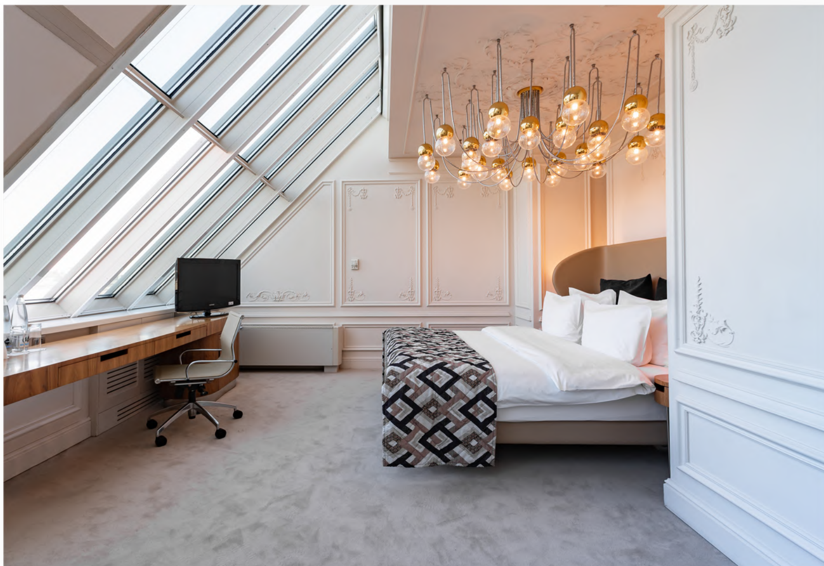
На фото: Мансардный Делюкс