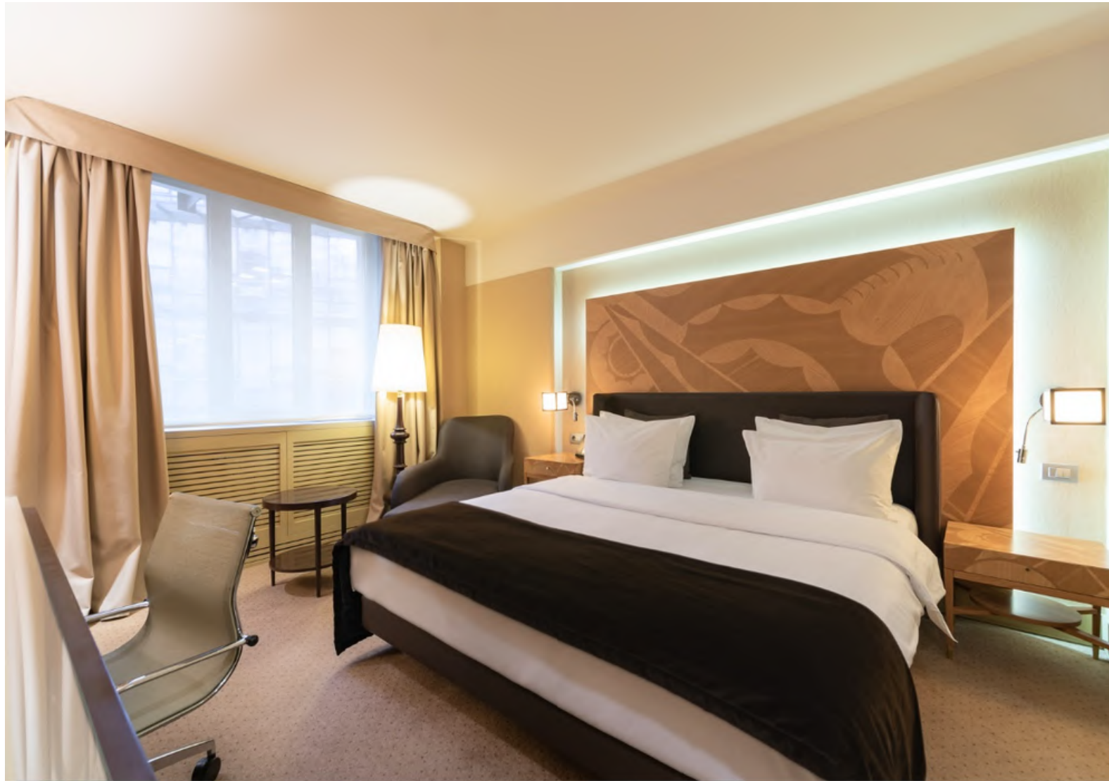
На фото: Стандартный номер с кроватью King-size